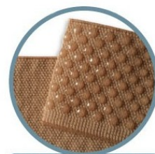
Bordo silicone a puntini